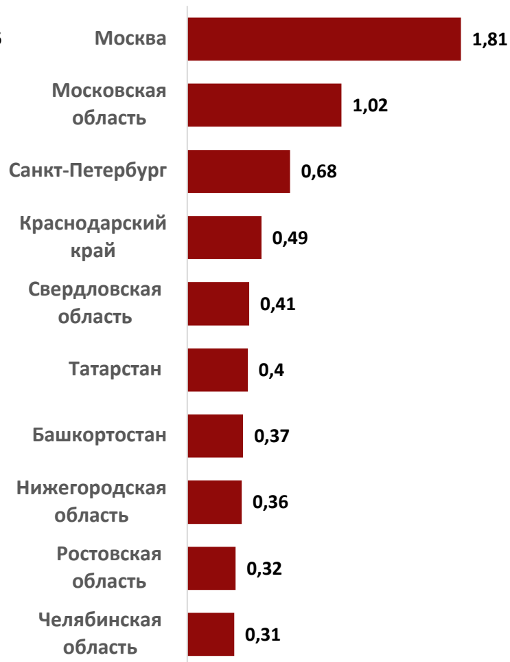
ТОП-10 РЕГИОНОВ ПО ПАРКУ SUV, МЛН ЕД.